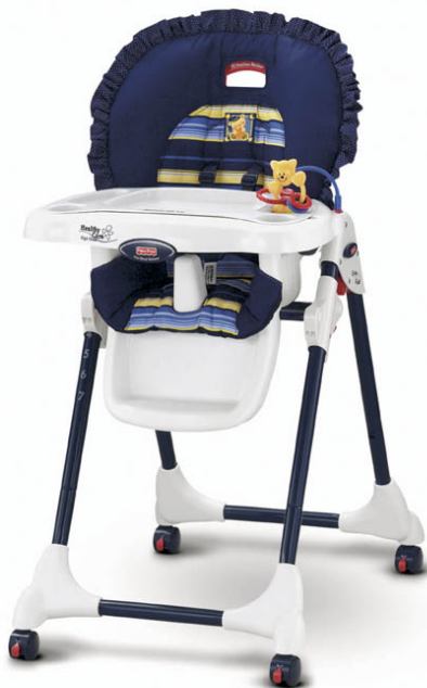
Silla Alta Healthy Care™ H1152