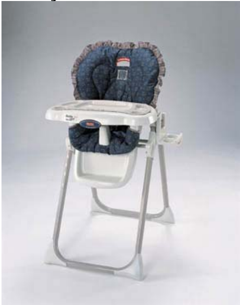
Healthy Care™ kinderstoel