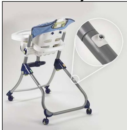
F-P Trona Cerca de Mi con clavija para guardar la bandeja