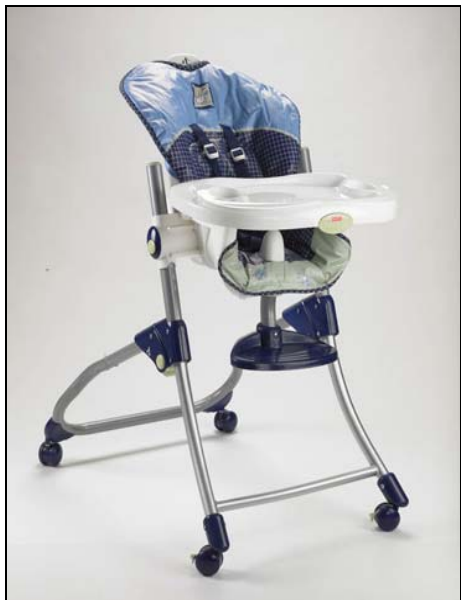
F-P Trona Cerca de Mi