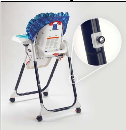
Silla Alta Healthy Care™ con clavija para guardar la bandeja