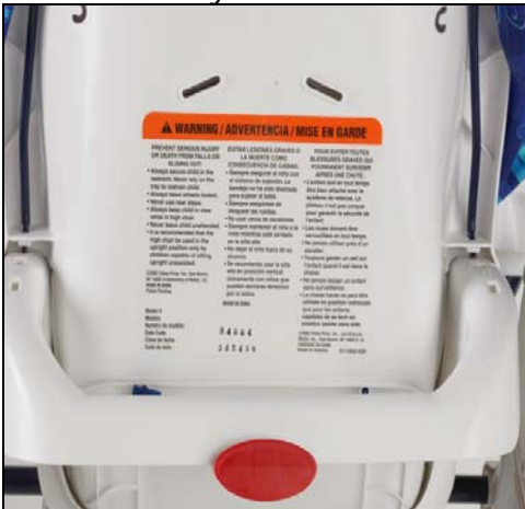
Silla Healthy Care™