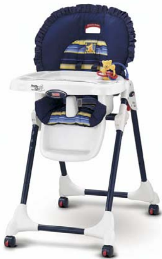
Silla Alta Healthy Care™