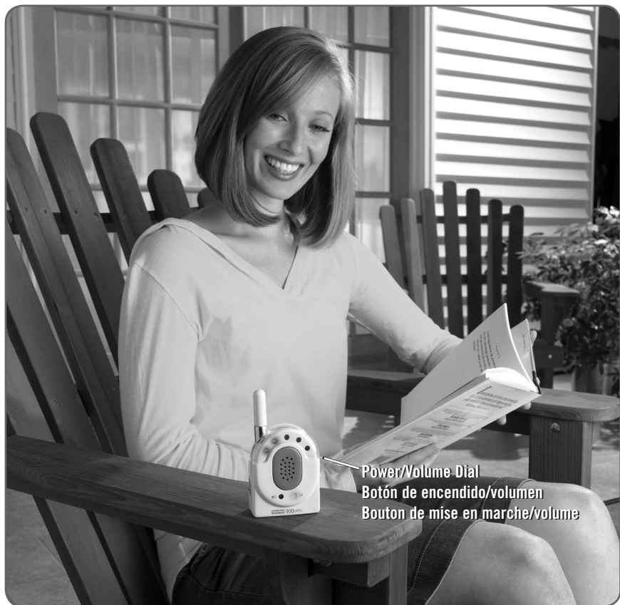
Power/Volume Dial Botón de encendido/volumen Bouton de mise en marche/volume