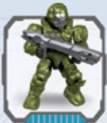
UNSC Spartan Operator • Operador Spartan de CENU Spartan Opérateur de l'UNSC • RVN Spartan Bediener RVN Spartan-operator • UNSC Spartan Operatore Operador Spartan do CENU

8 MICRO ACTION FIGURES TO COLLECT! FIGURAS DE ACCIÓN EN MINIATURA PARA COLECCIONARI! FIGURINES ARTICULÉES À COLLECTIONNER! MICROACTIONFIGUREN ZUM SAMMELN! ACTIEFIGUURTJES OM TE VERZAMELEN! PERSONAGGI DA COLLEZIONARE! MICRO FIGURAS DE AÇÃO PARA COLETAR!