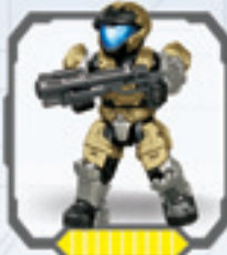
UNSC Spartan Air Assault • Spartan de ataque aéreo CENU Spartan d'assaut aérien de l'UNSC • RVN Spartan für Luftangriff RVN Spartan voor luchtaanvallen • Assalto Aereo Spartan del UNISFC Spartan de Ataque Aéreo do CENU