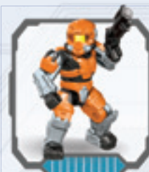
UNSC Spartan Hazop • Spartan Hazop de CENU Spartan Hazop de l'UNSC • RVN-Hazop-Spartan RVN Hazop Spartan • Hazop Spartan UNSC Spartan Hazop do CENU