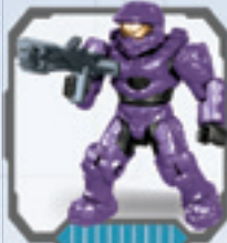
UNSC Spartan Mark VI • Spartan Mark VI de CENU Spartan Mark VI de l'UNSC • RVN Spartan Mark VI RVN Spartan Mark VI • Spartan Mark VI UNSC Spartan Mark VI CENU