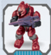
Covenant Storm Elite • Tormenta Elite de Covenant Elite Tempête du Covenant • Covenant Sturm Elite Covenant Storm Elite • Covenant Elite da Atacaa Tempestade Elite Covenant