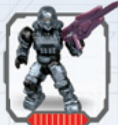
UNSC Spartan Soldier • Soldado Spartan de CENU Soldat Spartan de l'UNSC • RVN Spartan-Soldat RVN Spartan-soldaat • Soldato UNSC Spartan Soldado Spartan do CENU