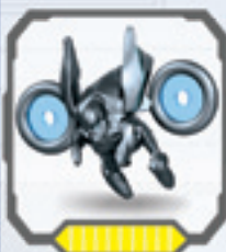
Promethean Watcher • Vigilante Promethean Observateur Promethean • Promethean Beobachter Promethean wachter • Promethean Osservatore Observador Promethean