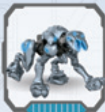
Promethean Crawler • Rastreador de Promethean Rampant Promethean • Promethean Kriecher Promethean rupsvoertuig • Promethean Strisciante Rasteador Promethean