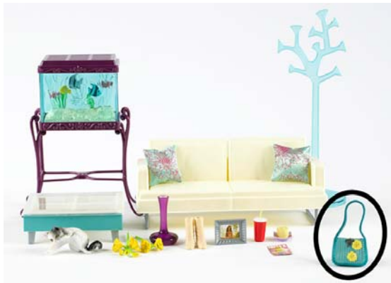
Art. K8613 (aus Sort. K8610 bzw. L1207) Barbie Sofa & Tisch (Wohnzimmer)