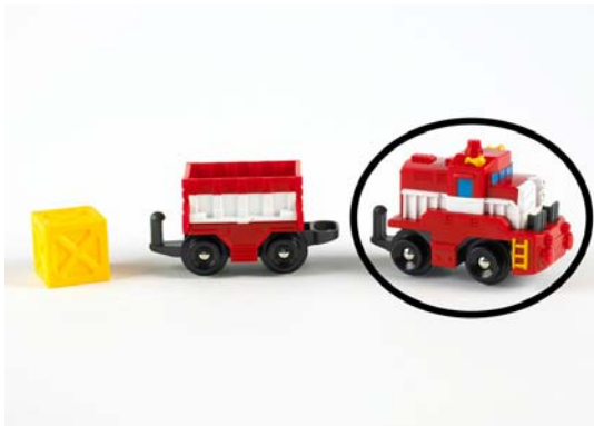
Art. H5705 – Geotrax Güterzug mit Waggon

Mattel bietet Konsumenten einen kostenfreien Umtausch der betroffenen Einzelteile an. Hinweise zur Abwicklung des Umtausches für Konsumenten aus Deutschland, Österreich und der Schweiz finden Sie auf unserer Serviceseite unter www.Mattel.de/service .