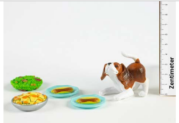
Umzutauschende Teile: Hund, Teller mit Futter, Salat, Kartoffelchips