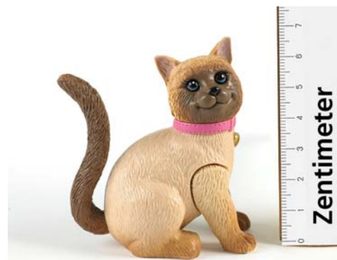
Umzutauschendes Teil: Katze