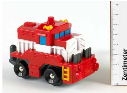
Umzutauschendes Teil: Lokomotive