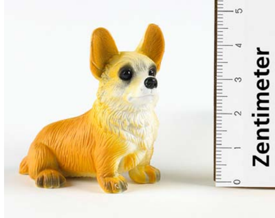
Umzutauschendes Teil: Hund