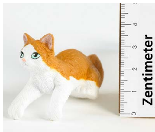
Umzutauschendes Teil: Katze