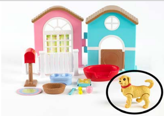
Art. J9485 (aus Sort. J9484) Barbie Hundehaus