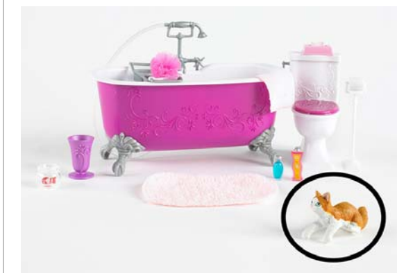
Art. K8607 (aus Sort. K8605) Barbie Badewanne & Toilette (Bad)