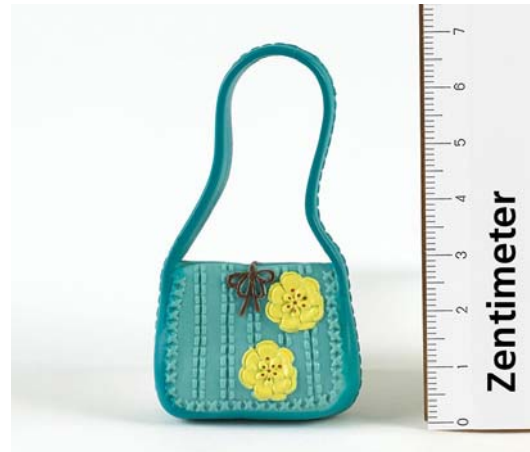
Umzutauschendes Teil: Handtasche

Mattel bietet Konsumenten einen kostenfreien Umtausch der betroffenen Einzelteile an. Hinweise zur Abwicklung des Umtausches für Konsumenten aus Deutschland, Österreich und der Schweiz finden Sie auf unserer Serviceseite unter www.Mattel.de/service .