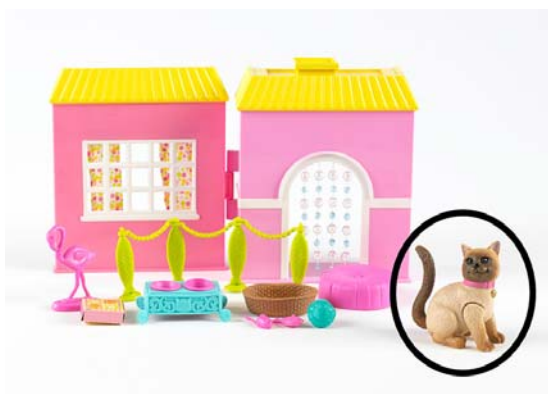
Art. J9486 (aus Sort. J9484) Barbie Katzenhaus