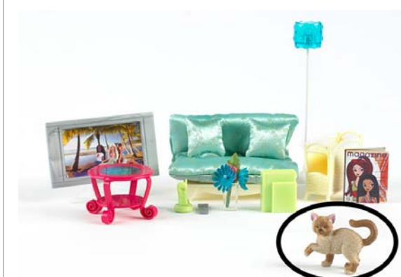
Art. K8608 (aus Sort. K8605) Barbie Sitzcouch & Tisch (Wohnzimmer)