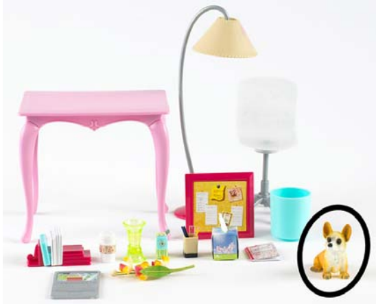
Art. K8609 (aus Sort. K8605) Barbie Tisch & Stuhl (Schlafzimmer)