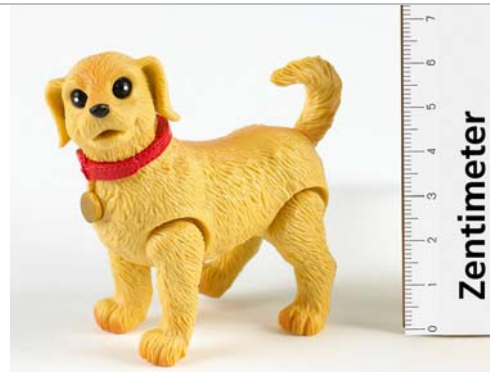
Umzutauschendes Teil: Hund