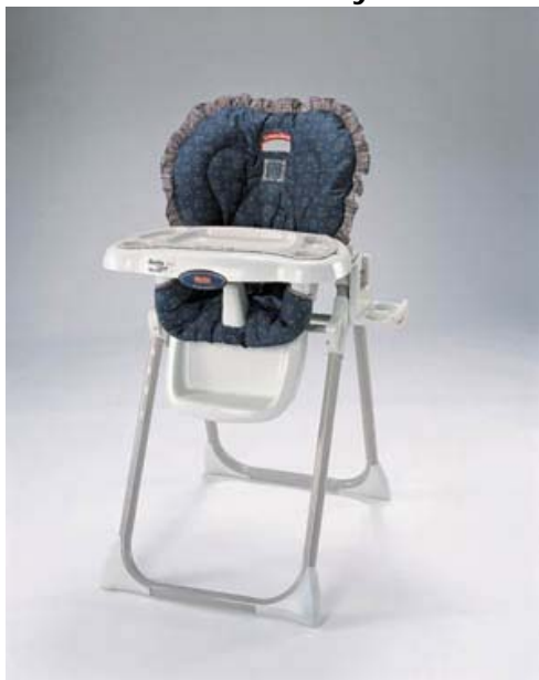
Silla Alta Healthy Care™