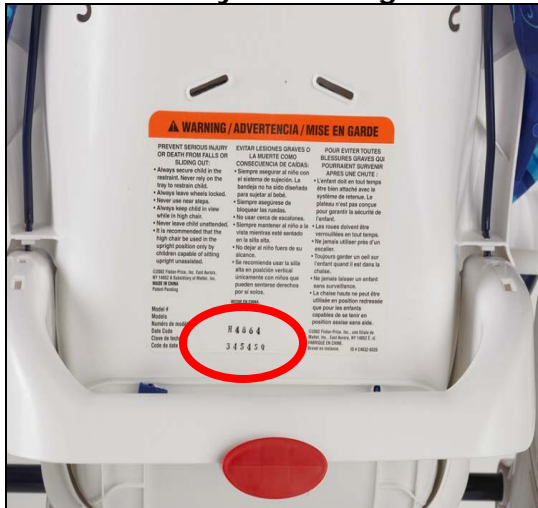
C6417 Healthy Care™ High Chair