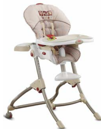
Chaise haute Easy clean

Localisez la référence de votre produit située sur le sticker blanc apposé sur le dossier du siège. Merci d'utiliser les images ci-dessous pour localiser la référence de votre produit.