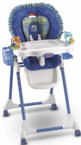
Chaise haute Link-a-doos

Exemples de photos des chaises hautes Link-a-doos, Close-to-me, Easy Clean ( les couleurs, formes et accessoires varient selon les chaises)