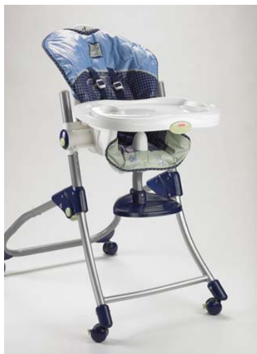
Chaise haute Close to Me