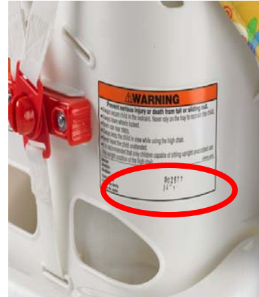
J6995 Easy Clean

Si vous ne possédez pas un produit qui corresponde aux produits présentés en photo ci-dessus, vous n'êtes pas concernés par ce signalement et vous pouvez continuer à utiliser votre chaise haute.