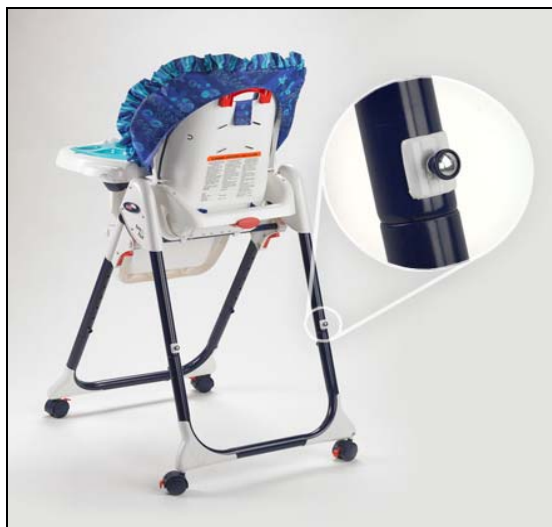
Foto esemplificativa dei prodotti (colori, foggia e giocattoli accessori possono variare)

Il suo seggiolone Healthy Care™ ha perni d'appoggio per il vassoio come mostrato nella foto sopra riportata?