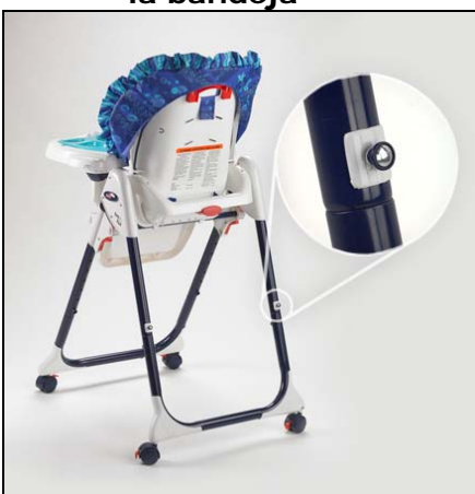
Silla Alta Healthy Care™ con clavija para guardar la bandeja