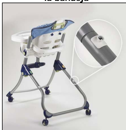
F-P Trona Cerca de Mi con clavija para guardar la bandeja