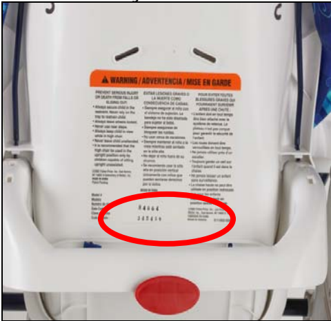
Silla Healthy Care™